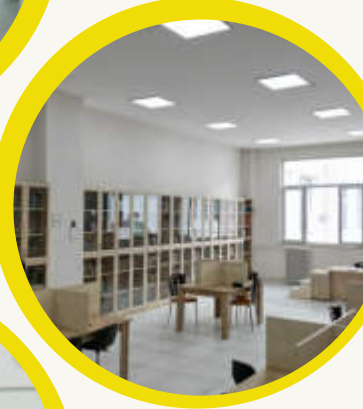
Geniş ve Ferah Sınıflarımız