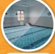
Kız ve Erkek Mescidi