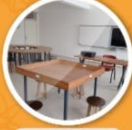
Robotik Kodlama Atölyesi