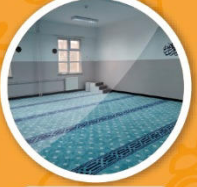
Kız ve Erkek Mescidi