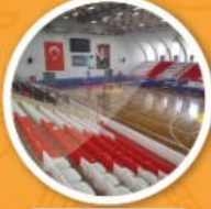
Kapalı Spor Salonu