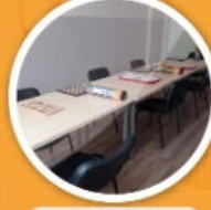
Zeka Oyunları Alanı