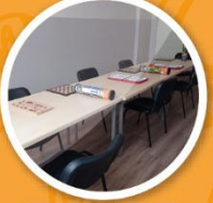
Zeka Oyunları Alanı