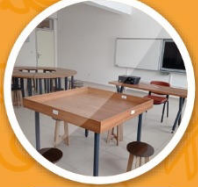
Robotik Kodlama Atolyesi