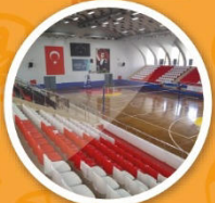
Kapalı Spor Salonu