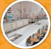
Fen Bilimleri Laboratuvarı