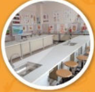
Fen Bilimleri Laboratuvarı